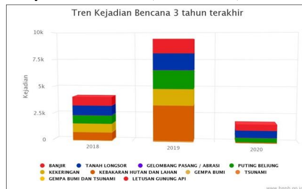
Gambar 1: Tren Kejadian Bencana Indonesia Tahun 2018-2020.

Berdasarkan data statistik Badan Nasional Penanggulangan Bencana (BNPB), sejak tanggal 1 Januari hingga 23 Juni bencana di Indonesia tahun 2020 BNPB mencatat 1.662 kejadian bencana di sejumlah wilayah di Indonesia, dalam 6 bulan terakhir bencana di dominasi oleh bencana tanah longsor, banjir dan puting beliung. Sekitar 638 kejadian tanah longsor dan sekitar 505 kejadian banjir yang terjadi di sejumlah wilayah di Indonesia. (BNPB, 2020).