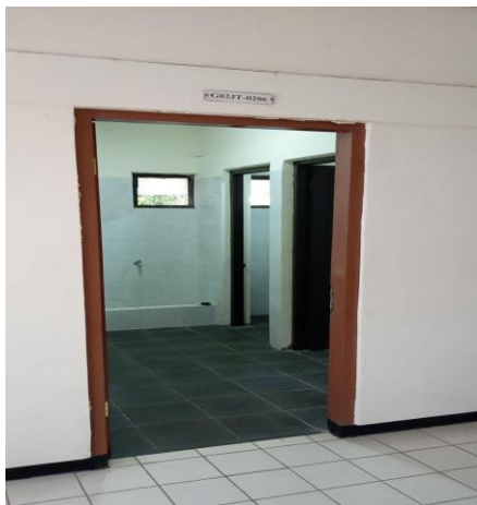
Hasil Penelitian (2022)

Observasi secara langsung dengan mendatangi kampus Unpad Jatinangor juga dilakukan dan melihat beberapa tempat yang berpotensi untuk menjadi tempat terjadinya kekerasan seksual memang di daerah yang sepi, kurang penerangan jalan dan juga jauh dari pos pengamanan satpam. Beberapa tempat yang dilakukan observasi adalah daerah jalanan saintek, Masjid Raya Unpad yang pertama (di depan FISIP) dan lingkungan kampus FISIP UNPAD sendiri khususnya gedung B, beberapa tempat yang berpotensi terjadi kekerasan seksual adalah salah satu fasilitas kamar mandi mahasiswa di Gedung B lantai 2 seperti gambar berikut ini: