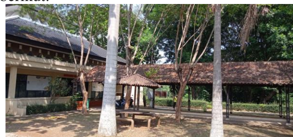
Hasil Penelitian (2022)

Pertanyaan No.3 adalah “Daerah-daerah mana sajakah yang menurut saudara memiliki potensi terjadi kekerasan seksual yang tinggi di Kampus Unpad Jatinangor?”. Mayoritas responden menjawab tempat-tempat yang sepi, kurang perawatan dan minim penerangan seperti, lahan/gedung/bangunan yang tidak terawat atau belum terfungsikan menjadi potensial untuk terjadi kekerasan seksual di lingkungan kampus Unpad Jatinangor. Selain itu juga, lokasi-lokasi seperti saung, toilet umum, taman, lorong menuju toilet, tempat parkir yang biasanya pohon sangat rimbun, jalan akses antar fakultas (ranah saintek) seperti yang tergambar dalam gambar berikut: